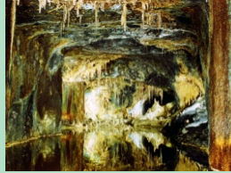
Feengrotten in Saalfeld