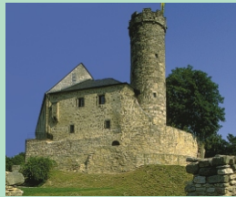
Burg Greifenstein in Bad Blankenburg